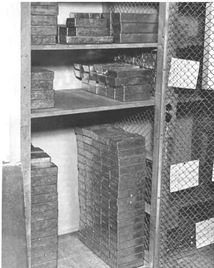
Nr. 3: Lagring av gullbarrer i det ferdige hvelvet, 1935.