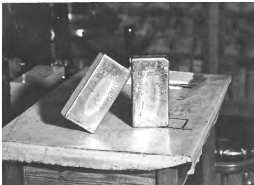
Nr. 1: Gullbarrer fra Norges Banks gullhvelv, 1935.

klares i Ryggs bok med at dekningsgullet ble bokført etter dagspris, mens det tidligere var bokført etter gammel pariverdi. 7