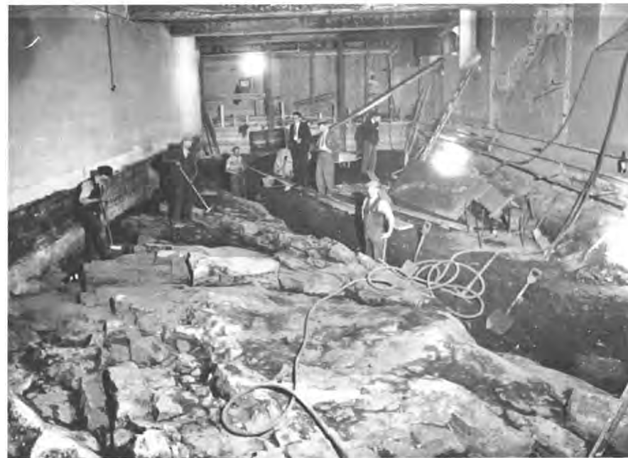
Nr. 2: Utgraving av nytt gullhvelv i Norges Bank, Bankplassen 4, i mellomkrigstiden.

Gullet utgjorde i alt 1 577 587,624 unse fint gull (ca. 48,8 tonn) til en samlet verdi av 55 215 566,84 dollar i 1946-verdi og kurs USD 35 pr. unse, jfr. London-direksjonens beretning. 10 Gullpriser noteres tradisjonelt i troy unse. En troy unse defineres i dag til 31,1034768 gram. Norske og svenske gullmynter fra unionstiden har et gullinnhold på 90%, og veier 4,48 gram (10-kronen) og 8,96