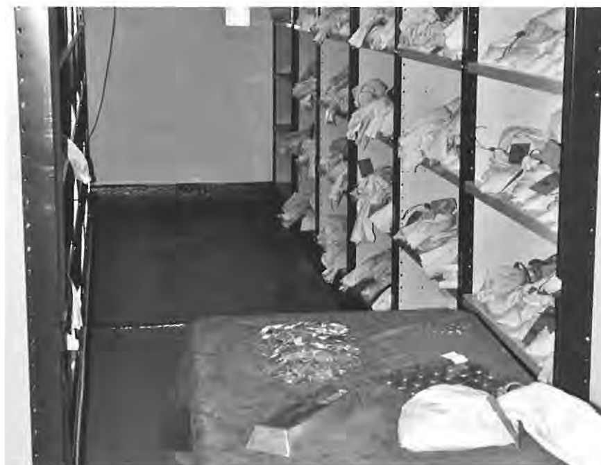
Nr. 7: Gullet oppbevares fremdeles i intakte poser i Norges Bank, 2004.